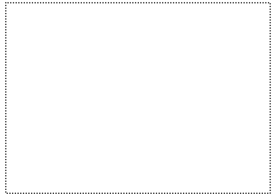
Fig.1 Sample of Figure Arrangement

そこで本研究では、まずソフトコピー上作業とハードコピー上作業を思考作業効率の観点から定量的に比較 1) することを試みた。..... .....ハードコピーの利点を持ち合わせた新しい媒体 2) のコンセプトの必要条件について探ることも意図するものである。